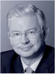
Roland Koch, Ministerpräsident des Landes Hessen

Hessen zählt zu den wirtschaftsstärksten und leistungsfähigsten Regionen Europas. Die Weiterentwicklung und Stärkung unseres Wirtschaftsstandortes ist eines der Hauptanliegen der Hessischen Landesregierung. Die hierfür notwendigen Impulse können allerdings nicht nur aus der Politik kommen; Innovation, Kreativität und Flexibilität eines jeden Unternehmens sind essenziell für eine insgesamt florierende Wirtschaft. Ich wünsche allen Teilnehmern des Unternehmergipfels interessante Erkenntnisse nach der Devise: Die Zukunft zu erfinden, ist die sicherste Methode, sie vorherzusagen.